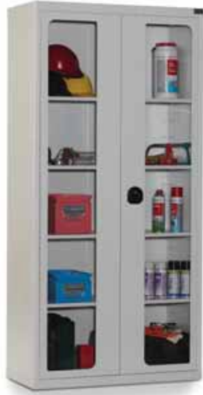
Pleksiglas Kapılı / Plexiglass Door