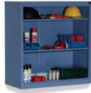
Kapısız / w/o Door