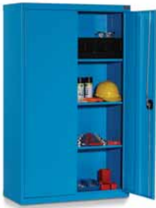
Panel Kapılı / Solid Panel Door

* : Rafların dolap içindeki pozisyonları ihtiyaca göre ayarlanabilir. / Shelf positions within the cupboard can be adjusted as desired. ** : En çok tercih edilen konfigürasyon. / Most popular configuration.